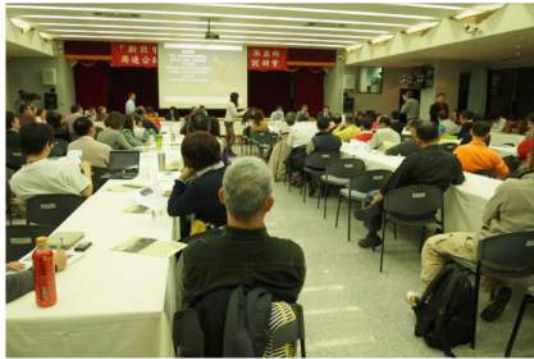
由新北市政府財政局在2013年2月26日晚上在新莊區公所所舉辦的「新北市新莊區文德段新莊派出所周邊公私有地都更案第四次說明會」。該說明會為第一次該案公開讓任何有興趣的民眾參與。