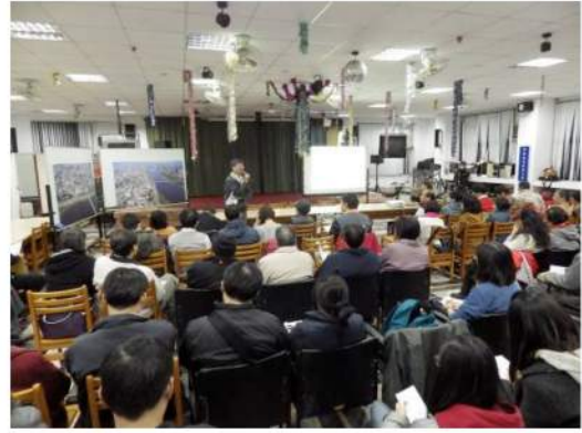
新莊老街永續觀光產業發展聯盟於2012年12月24日晚上在文明文德社區活動中心所舉辦的「新莊都市更新社區論壇-老街再造篇」活動照片。該論壇為該公辦都更案第一場民間自主性舉辦之活動。